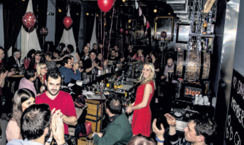
VÍTEJTE. Nezadaných se najde vždycky dost!