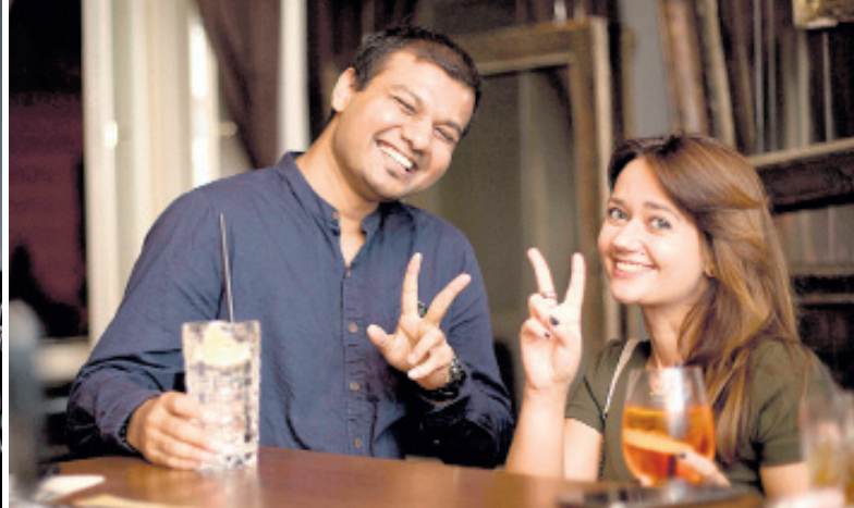
U NÁS DOBRÝ! Seznamování nás baví.

T y záplavy seznamek mě fascinují už dlouho. Seznamky pro náročné, nenáročné, na sex, na jednu noc, pro hezké lidi, pro osklivé lidi. Nebo třeba takzvaný sugar dating, kde si mladé krásné slečny hledají bohaté pány, kteří jim za společnost a sex nabídnou luxus, dárčky anebo dovolenou, na kterou by si samy nenašetřily. Mám pár kamarádů, kteří tráví spoustu času na seznamkách. A ano. Taky jsem se tam párkrát mrkla. Ale ta záplava smejících se nebo mračících se hlav se školou života mě vždycky spíš vyděsila. Jak si tady někdo dokáže vybrat toho pravého?