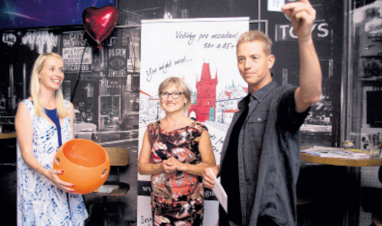
TOMBOLA. Nejdřív se seznámit a pak vyhrát!

jsou víc v klidu. Chtějí se pobavit a něco už mají za sebou. Co přijde, to přijde. „Ale 98 % těch, kteří na večírky chodí, jsou bezva. Mají odvalu a já všem dokola opakuji: žádná očekávání, žádné zklamání.“