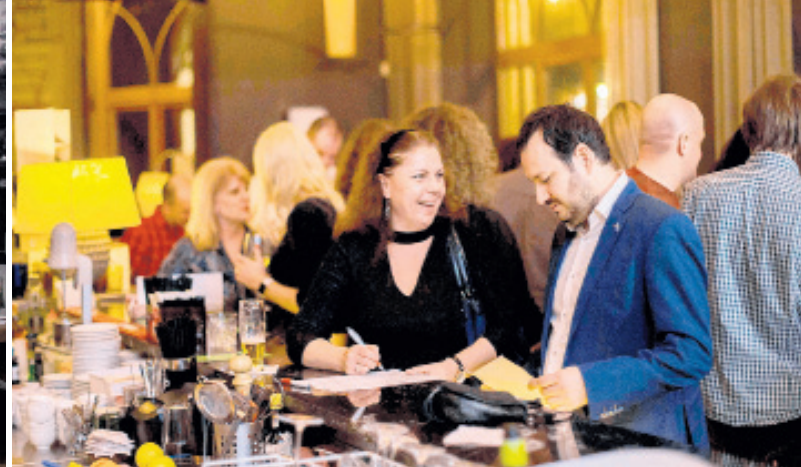
ÚKOLY. A máte červené auto?

„Vy jste pěkné! O vás bude zájem!“ pokračuje s neskrývanou radostí, až začnu mít obavy, aby ho ten zájem ještě víc nevyplašil. Každý vyfasujeme